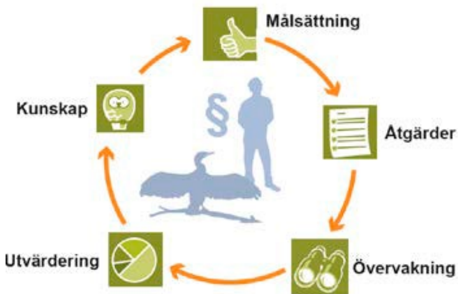
Figur 1. Schematisk bild över den adaptiva förvaltningen 1 .

Förvaltningen av skarv ska, som all viltförvaltning, vara adaptiv. En adaptiv och flexibel förvaltning definierar först mål för de områden som ska förvaltas. I nästa steg genomförs planerade åtgärder. Under förvaltningsarbetet sker en löpande övervakning av utvecklingen och justeringar görs utifrån behov. Sådana justeringar kan göras om åtgärder inte visar sig ha avsedd effekt, om omvärldsfaktorer förändras eller om ny kunskap tillkommer. Figur 1 åskådliggör dynamiken i den adaptiva förvaltningen, där målsättningen med förvaltningen är det första steget.